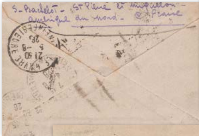
15 Pli retourné à l'expéditeur au type « P.P. » O 30.

À en croire ces imitations du cachet 18 et du timbre à date, les courriers revêtus de l'empreinte « P P O 05 »