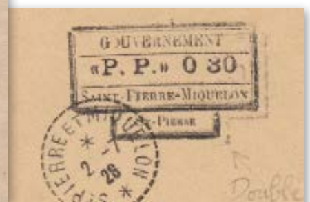
17 Double frappe partielle du cachet.